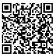
รายละเอียด KPI Template